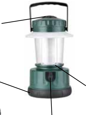
Toma para cargar